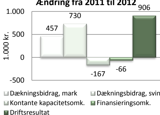
Figur 1: Figuren viser ændringen fra 2011 til 2012 for forskellige regnskabsposter.